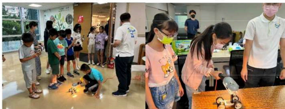
圖：AI 智慧建築節能工作坊互動實作示意（兩天室內競賽）

於互動實作後預留部分時間進行如接力賽或計時賽等小組競賽活動，以作為本次工作坊學習成果的檢驗；因應全球淨零排放浪潮，將以「太陽能驅動創意組(再生能源智慧模型)」作為小組競賽工具，透過小組競賽活動鼓勵學員挑戰不同的組裝模式，進一步培養他們的程式邏輯概念和團隊合作能力。在競賽中，學員需要分工合作，運用於課堂上習得的太陽能驅動原理，溝通最適宜運行的設計並組裝模型。此外，競賽活動為學員提供了一個實踐和展示他們所學的平台。學員不僅可以展示他們所創造的模型和解決問題的方法，還能將所學的再生能源應用融入實際生活情境中。不僅激發學員的學習動力，還能增進學員對節能減碳和再生能源應用的知識。透過實際參與和展示，學員將更深入地理解並體驗到智慧建築節能應用在日常生活中的重要性。