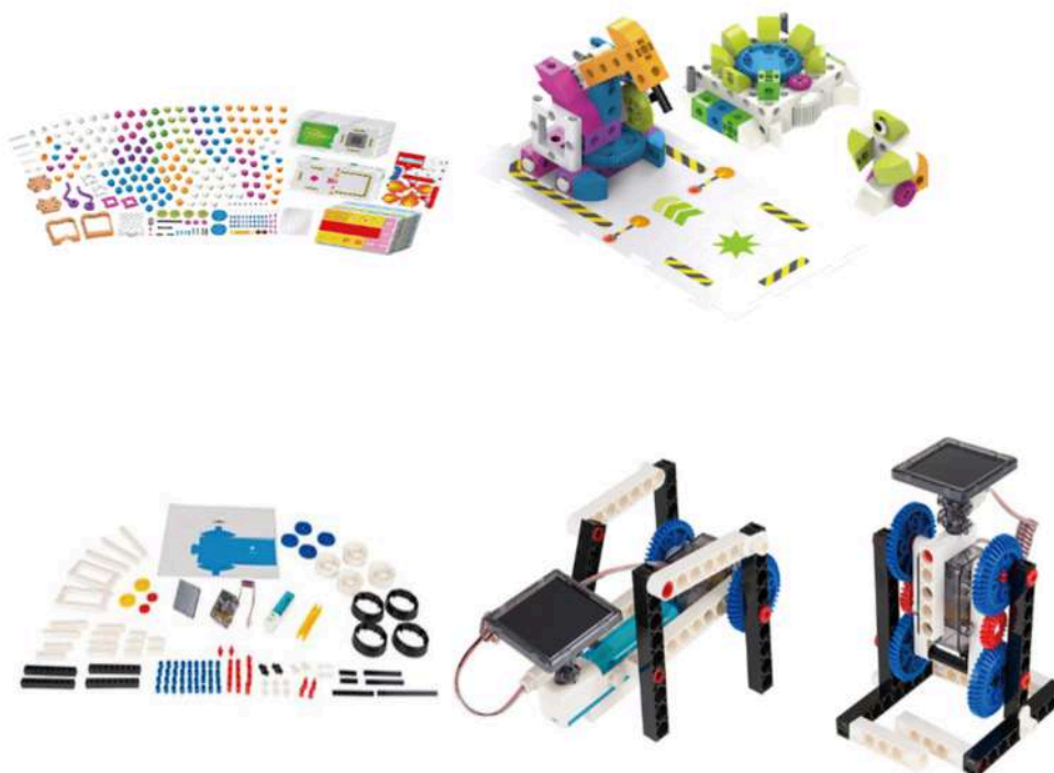
圖：AI 智慧建築節能工作坊預定採用教材與組裝成果示意

藉由專業講師以主題式說明完「AI 智慧邏輯訓練模型」與「再生能源智慧積木模型」，在工作人員的協助下，由小組學員於本節課程透過動手實際組裝，體驗 DIY 智慧生活科技產品的樂趣。本工作坊將採用「程式邏輯教育機器人(AI 智慧邏輯訓練模型)」與「太陽能驅動創意組(再生能源智慧模型)」作為實作教材，除可深化學生對能源與智慧建築節能應用的意識外，「太陽能驅動創意組(再生能源智慧模型)」亦可作為小組競賽的成果展示，學生們可以在戶外的陽光下使用太陽能活動板驅動雙用電動機，並且可以利用太陽能蓄電池座進行能量儲存，實現簡易的再生能源利用功能。這樣的學習方式使學生以輕鬆活潑的方式認識節能觀念，未來更可以應用於智慧建築等設計，進一步達到科學普及向下紮根教育的目標。