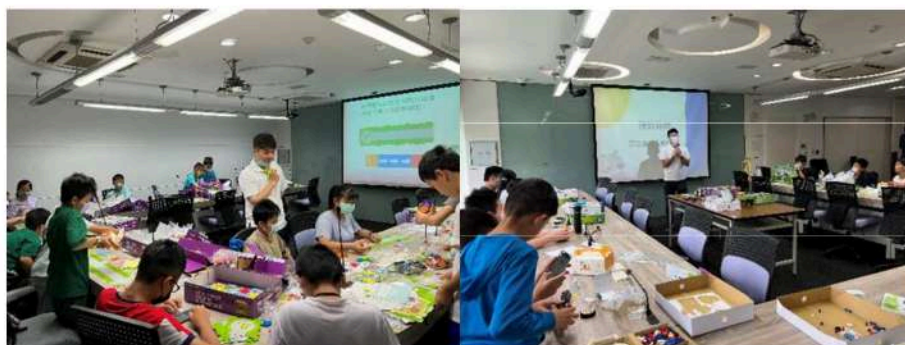
圖：AI 智慧建築節能工作坊互動實作示意