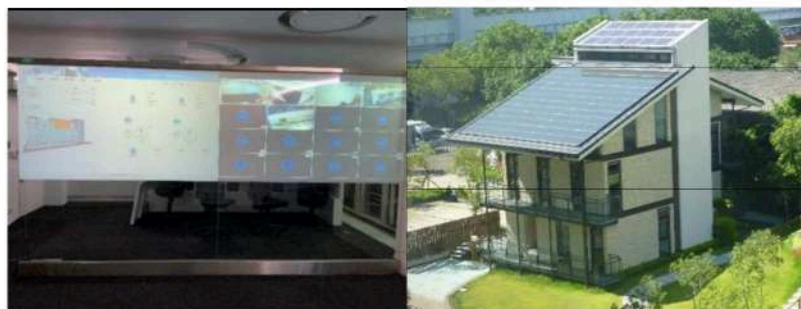
圖：智慧化居住空間案例導覽觀摩預定解說場域

希冀透過實際觀看 AI 智慧建築場域，他們將能夠了解智慧化居住空間中不同場景的設計概念、智慧設備的運作原理以及它們對生活的影響。透過實例觀察和體驗，將有助於學員更深入地理解智慧科技在居住空間中的應用，並激發他們對科技創新的興趣和想像力。