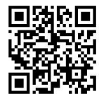
桃園市國民小學藝術才能音樂班 鑑定線上報名系統

1、申請方式及時間：採線上申請成績複查，114 年 5 月 5 日(星期一)00:00 至 5 月 6 日(星期二)中午 12:00 前至桃園市國民小學藝術才能音樂班鑑定招生線上報名系統( https://tyc.sfes.tyc.edu.tw/elmmusic/ )申請複查(如附件七)，逾時不予受理。