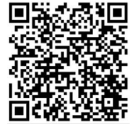
桃園市國民小學藝術才能音樂班 鑑定線上報名系統

三、承辦學校大成國小網頁( https://www.dches.tyc.edu.tw/ )